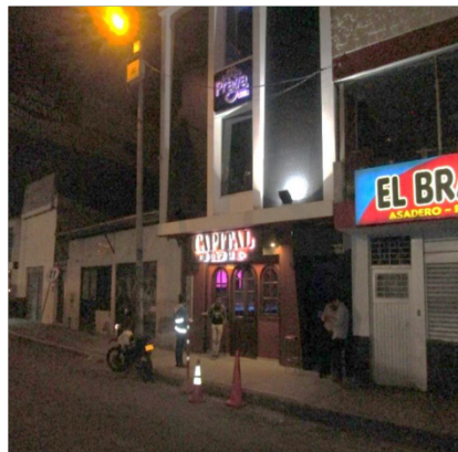
Fotografía No 1. Vista general de ubicación del establecimiento CAPITAL VIP LIQUOR STORE y predio colindantes.