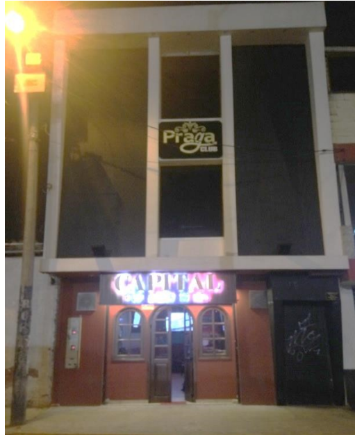
Fotografía No 2. Registro del predio en el cual se ubica el establecimiento sujeto a estudio (primer nivel)